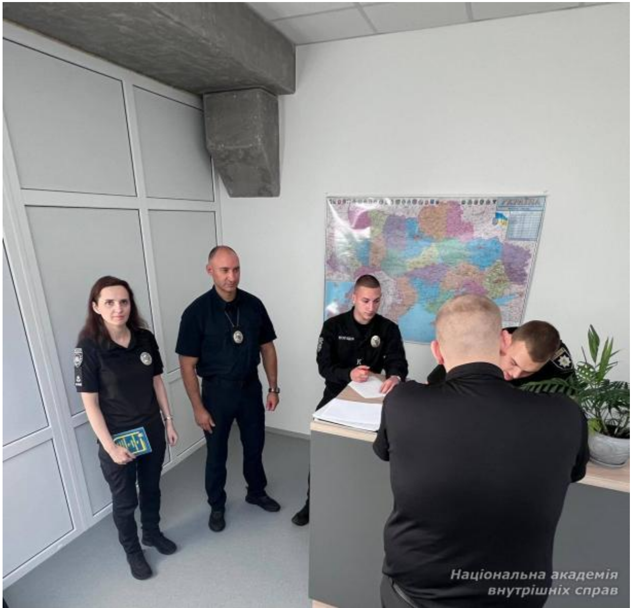
Національна академія внутрішніх справ