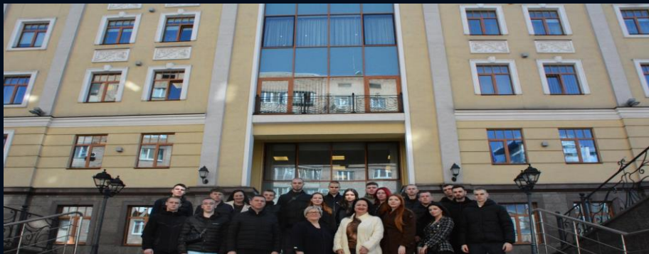
Вища рада правосуддя