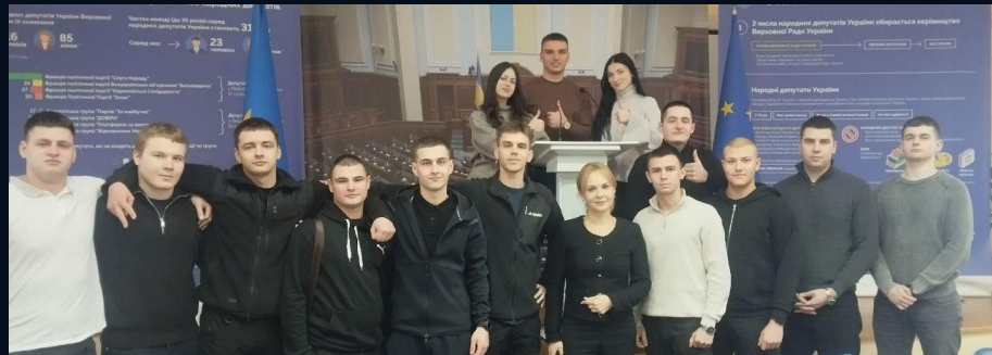
Верховна Рада України