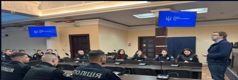
Вищий антикорупційний суд України